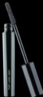
TOP LASH 360° Máscara de pestañas