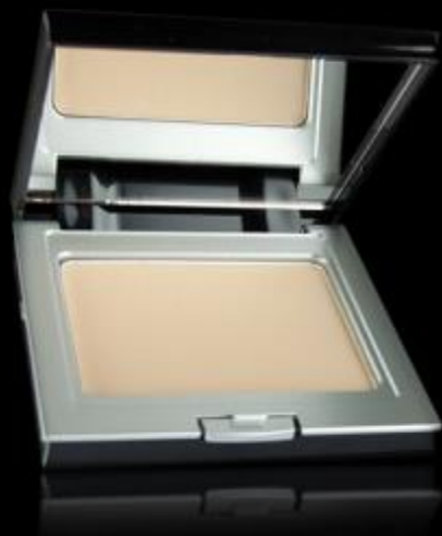
LIGHT DIFFUSING Polvo iluminador

Los PUNTOS DE LUZ se utilizan para dar un acabado final al maquillaje. Recomendamos aplicarlo en los pómulos, el puente de la nariz, el mentón, el perfil de los labios y clavículas.