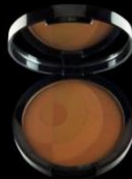
MINERAL SHEER MATTE BRONZER Polvo bronceador