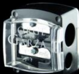
SACAPUNTAS DE MAQUILLAJE