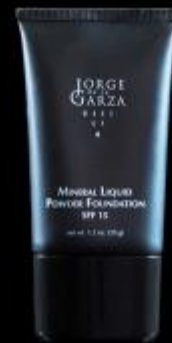
LIQUID POWDER MINERAL FOUNDATION SPF15 Base fluida