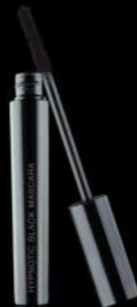
HYPNOTIC BLACK MASCARA Máscara de pestañas