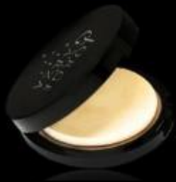
POLVO COMPACTO MINERAL DOBLE FUNCIÓN SPF8 Polvo compacto