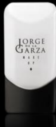
LIQUID EYE LINER Eye liner líquido