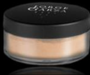
POLVO SUELTO TRASLÚCIDO Polvo suelto