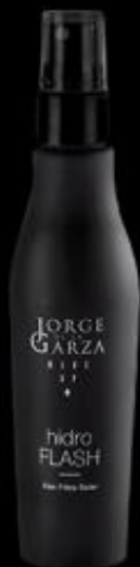
HIDROFLASH Base tensora

Los PREVIOS sirven para acondicionar la piel para el maquillaje. El maquillaje se fijará mejor y durará más.