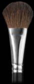
PINCEL P-10 Pincel de colorete

Los PINCELES son imprescindibles para lograr una correcta aplicación del producto y conseguir el efecto deseado. Se pueden clasificar por zona de aplicación (rostro, labios, ojos, cejas), forma (plano, biselado, cónico) o por material (pelo natural, sintético, cerdas).