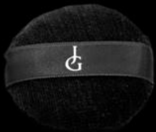
BORLA DE MAQUILLAJE