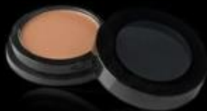
COLORETE POLVO COMPACTO Colorete compacto

Los ACABADOS marcan la diferencia en cualquier maquillaje ya que acaban de definir el volumen del rostro. Por eso la elección de un buen colorete o bronceador para contornear el rostro es muy importante.