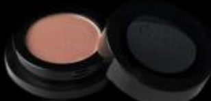
SOMBRA SATINADA Sombra compacta