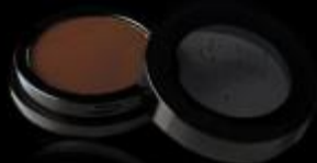
SOMBRA MATE Sombra compacta

Los OJOS es lo siguiente que maquillamos. Podemos encontrar diferentes texturas (polvo, crema, stick), acabados (brillante, mate, satinado) y presentaciones (compacto, lápiz, stick, roll-on).