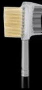
PINCEL P-13 Peine de cejas y pestañas