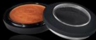
PURE COLOR EXTREME Sombra en crema