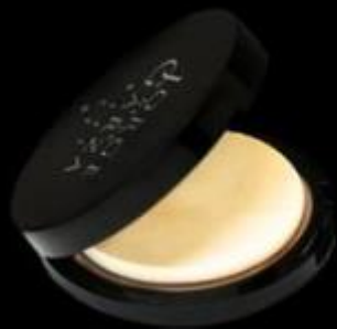
POLVO COMPACTO DOBLE FUNCIÓN Polvo compacto

Los POLVOS se aplican después de la base y sirven para matizar y fijar el maquillaje. Los hay de diferentes texturas y formatos para poder conseguir resultados distintos.